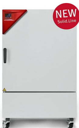
Модель KBF-S 240